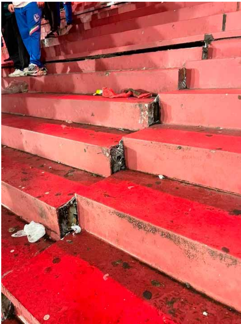
Movimiento. Así quedó la tribuna de Independiente

Esta situación no representaría ningún riesgo para la realización del partido de Copa Argentina de la próxima semana entre Huracán y Argentinos Juniors.