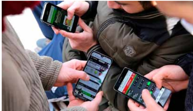
Preocupación. Por el crecimiento exponencial de las apuestas entre los jóvenes

En ese sentido, Atanasof destacó que el 80% del juego que juegan hoy los menores, es ilegal, y el 20% legal. "Estamos fortaleciendo ese sistema de control incorporando datos biométricos con pruebas de vida. También estamos trabajando fuertemente para combatir algo que no es fácil, que es el juego ilegal. Son estructuras delictivas que tienen licencias internacionales", señaló el funcionario. Y agregó que otra medida es el bloqueo de los sitios