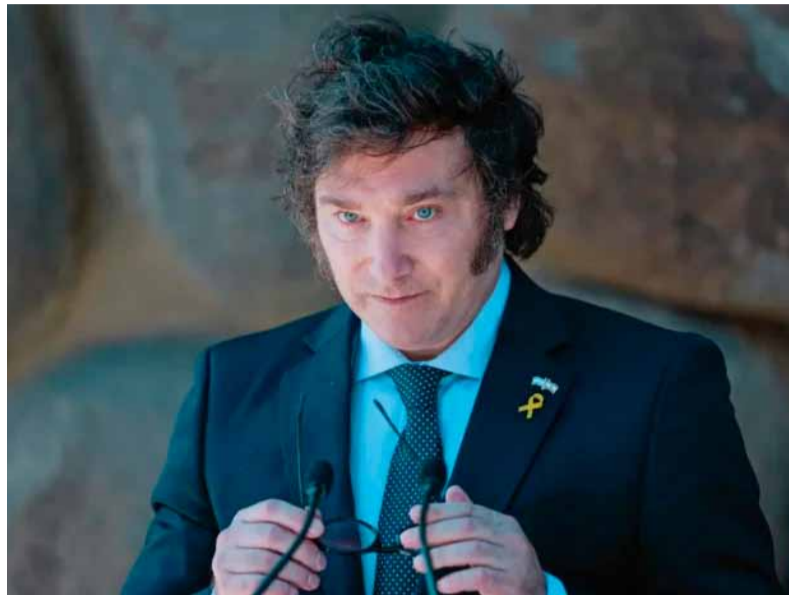
Críticas. De Javier Milei, luego de conocerse la denuncia por violencia contra Alberto Fernández

Ante esos hechos, en las redes sociales se produjo un aluvión de mensajes de repudio al Expresidente, que se extendieron también al progresismo en general (referentes del mundo de la cultura, la ciencia, la política, la educación fueron cuestionados) y al kirchnerismo en particular. La mayor