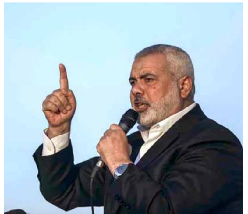
Ministro. Ali Bagheri Kani

Por su parte, el secretario de Asuntos Exteriores británico precisó que el asesinato de Haniyeh fue un “retroceso” para el logro de un cese al fuego en Gaza. Pidió a Irán ejercer la automoderación porque “habría consecuencias catastróficas” si las partes involucradas hacen lo contrario, lo cual no sería beneficioso para nadie.///