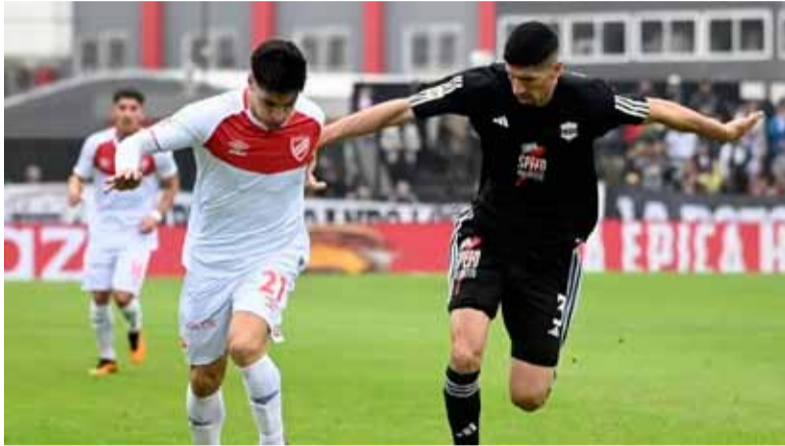
Recuperarse. LO que busca Argentinos Juniors, en su estadio esta tarde