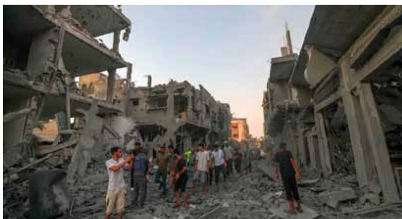
Dolor y destrucción. Gaza ha sido arrasada por la guerra