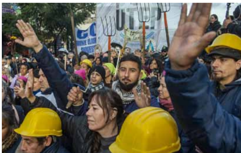
Movilización. Con críticas al gobierno nacional por su política económica

A las 10 la peregrinación partió desde la intersección Cuzco y