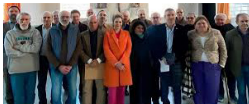
Difusión. De la foto entre diputados y genocidas

La escandalosa visita de un grupo de diputados y diputadas a represores presos por delitos de lesa humanidad fue retratada en al menos una fotografía, una imagen que se conoció hoy.