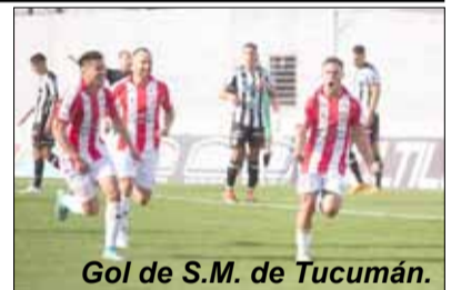
Gol de S.M. de Tucumán.