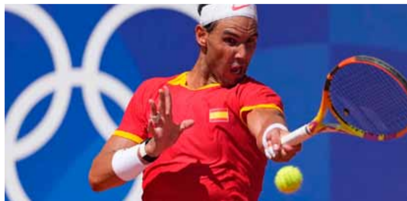
Nadal. Se bajó del último Grand Slam

Por otra parte, en el kite femenino, la argentina Catalina Turienzo también se vio afectada por la falta de viento y sus cinco regatas podrían correr la misma suerte que en el Nacra 17.