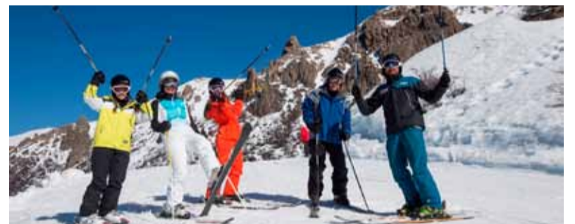
Impacto. Dejó de existir la "cuota cero"

El fondo se utilizó en tres oportunidades: en 2009, con la agencia Imaginar; en 2018, con Snow Travel y, en 2019, con Wayla Travel. (DIB)