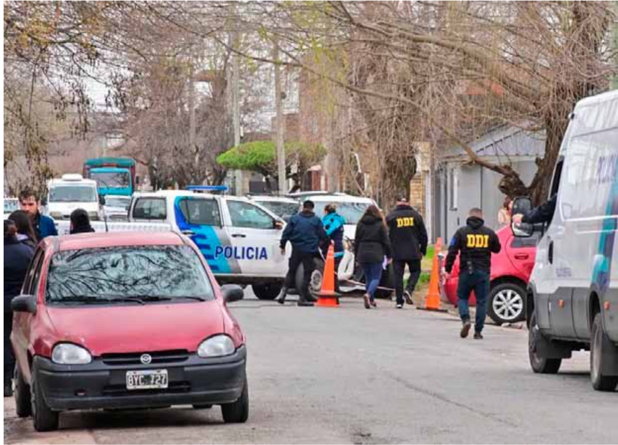
Operativo. En el domicilio de Grecia y Libertad

La víctima estaba desaparecida desde el sábado a la madrugada