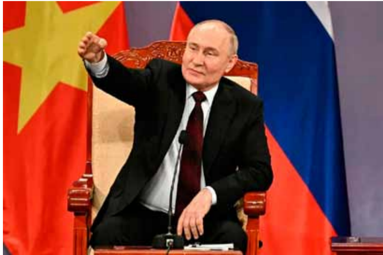
Acusación. De Putin a Ucrania por un ataque en la frontera

El presidente de Rusia, Vladimir Putin, denunció este miércoles que las tropas de Ucrania dispararon contra civiles durante su incursión en la provincia de Kursk, algo que la prensa de su país calificó de